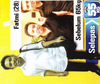
Fatmi (28) Sebelum 65kg Selepas 55 KG